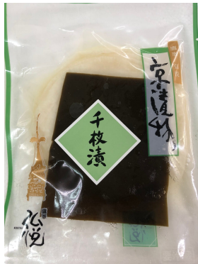
弘悦 千枚漬け 250g 1,080円(税込)