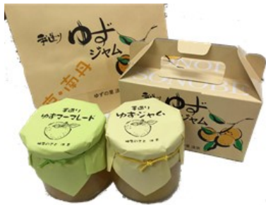
ゆずの里法京 ゆずジャム マーメイド 各500円(税込)