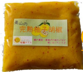
美山 板橋テラス 完熟柚子胡椒 550円(税込)