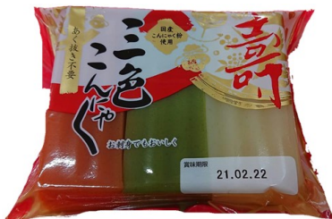
伏見屋 三色こんにやく 250円(税込)