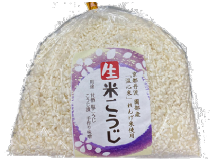
園部町つつじの会 生米こうじ 500円(税込) 数量限定販売のためご予約をおすすめします