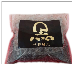
京都祇園フリアン持製 園部産 黒豆使用 黒豆煮 固形量300g 1,000円(税別) 数量限定予約販売 12月25日(金)まで