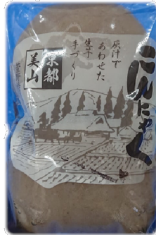
菅野こんぼく 手造りこんぼく 8円(税別)