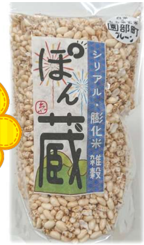
サンクリエイト ぼん蔵 540円(税込)